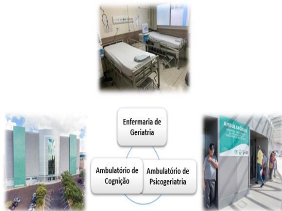
Figura 1: Cenários de atuação dos Psicólogos Residentes no ciclo da Geriatria.

Trata-se de um relato de experiência da atuação de Psicólogos Residentes na Geriatria, realizado no Hospital das Clínicas da Faculdade de Medicina de Botucatu, no período de março a agosto de 2020. O referencial teórico utilizado é o de Psicoterapia Breve de Orientação Psicanalítica.